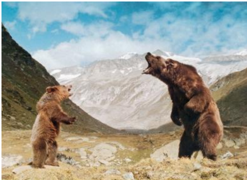
Der Grizzlykönig und sein Schützling

Was man jedoch anfangs nicht sehen konnte, war, dass ein riesiger Grizzlybär hinter dem kleinen Bären stand und sich auf seinen mächtigen Hinterpranken aufgerichtet hatte, um den Puma mit furchteinflössendem Brüllen und Drohgebärden in die Flucht zu schlagen. Es war der Grizzlykönig. Er hatte wohl das Brüllen des Bärenjungen gehört und folgte vielleicht einem natürlichen Instinkt, um den jungen Bären zu schützen – eher war es wohl aber eine glückliche Fügung für das Jungtier, weil sich der Grizzlykönig durch den Puma selbst bedroht sah.